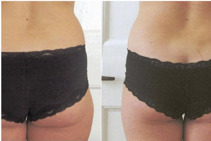
Une nouvelle technique d'amincissement rapide et sans douleur débarque en France.